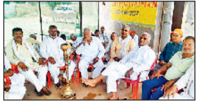
कनीना। कट बनाने की मांग को लेकर धरने पर बैठे ग्रामीण।