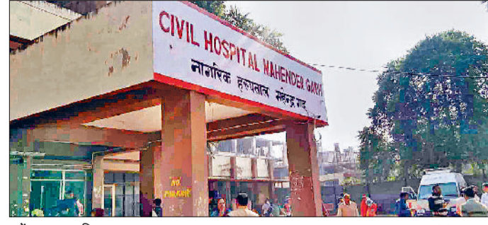
महेन्द्रगढ़। नागरिक अस्पताल का भवन।

मिला तो यहां लोगों को काफी उम्मीद थी कि उनको अपने शहर में नि:शुल्क स्वास्थ्य सेवाएं मिलेंगी, लेकिन लोगों की उम्मीदें धरी की धरी रह गईं। चार साल बीतने के बाद भी शहर के नागरिक अस्पताल की सुविधाओं में कोई बदलाव नहीं आया है। प्रतिदिन आते हैं करीब 60 से 70 मरीज: शहर के नागरिक अस्पताल के अंतर्गत करीब 103 गांव आते हैं। वहीं