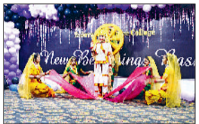
नारनौल। सांस्कृतिक कार्यक्रम प्रस्तुत करती छात्राएं।